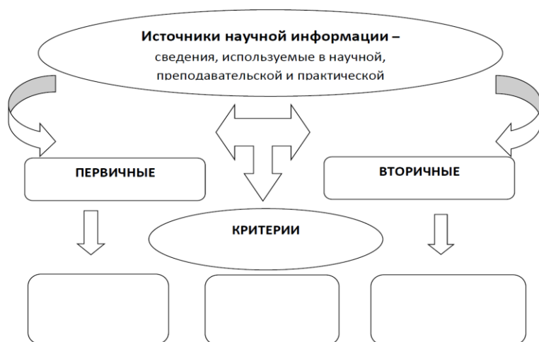
Схема. Источники научной информации

Задание 1.2. Прочитайте дополнительные материалы. Выберите автореферат диссертации по теме, близкой вам и оцените актуальность темы, отразив результаты анализа в таблице.